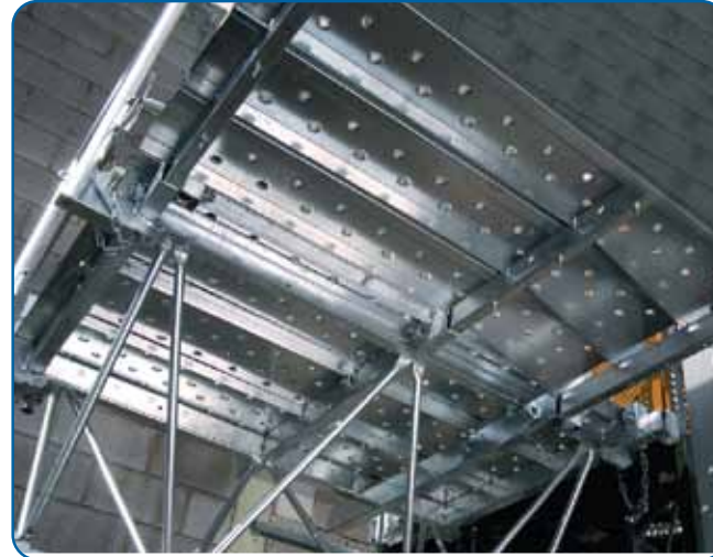
Extensibles con suelo de chapa de acero galvanizado Extensions with galvanized floor plates