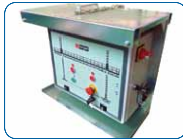
Cuadro de control Control panel