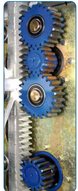
Piñones de grupo motriz y paracaídas Drive unit and overspeed brake pinions

Para mayores longitudes de plataforma o de extensibles, consultar con nuestro Departamento Técnico Ask our Technical Departement for special specifications like longer platform or longer extensions