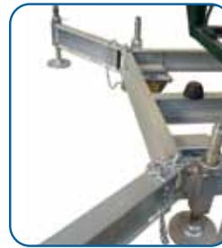
Detalle de la base Base frame detail